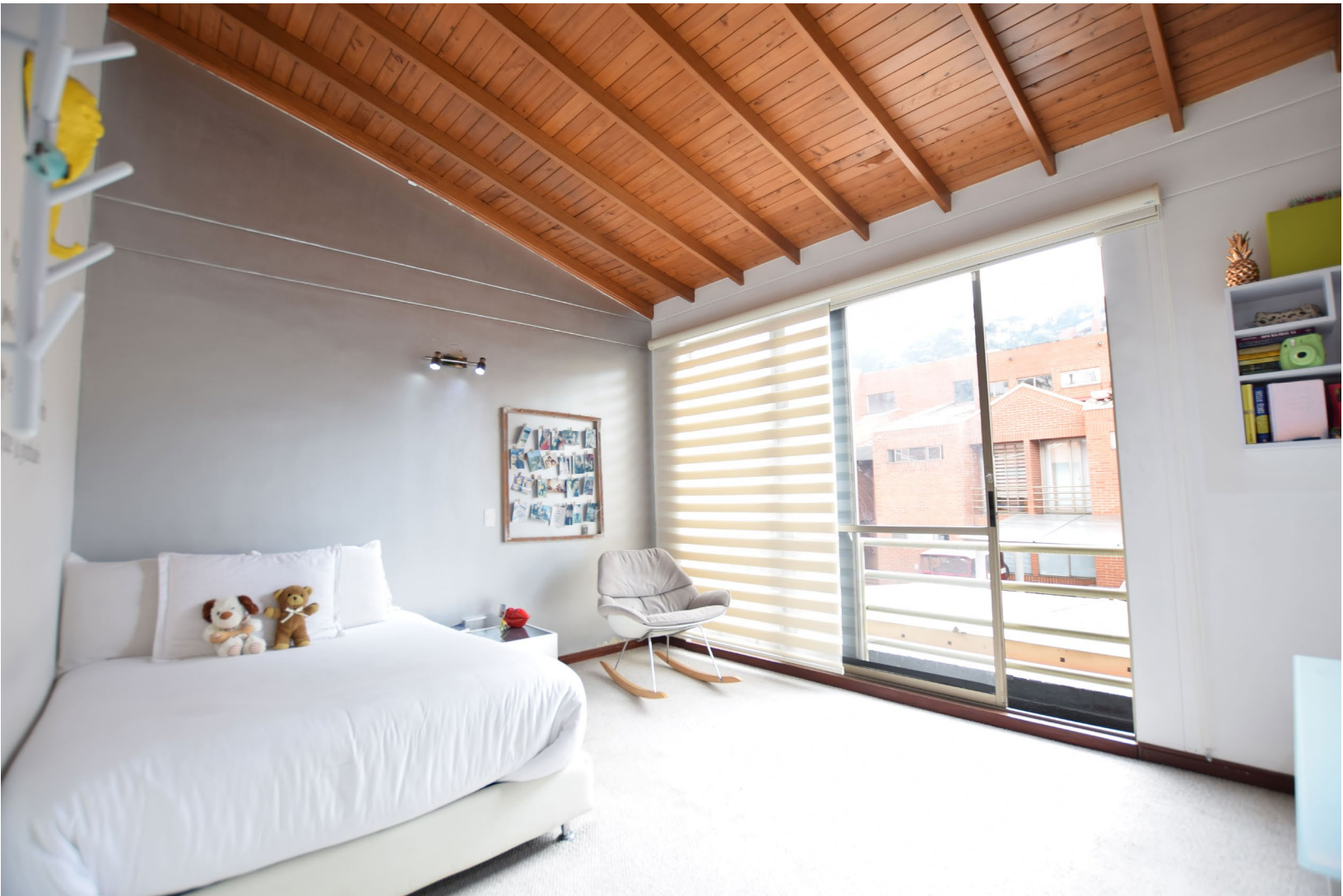
Espacio muy claros llenos de luz natural