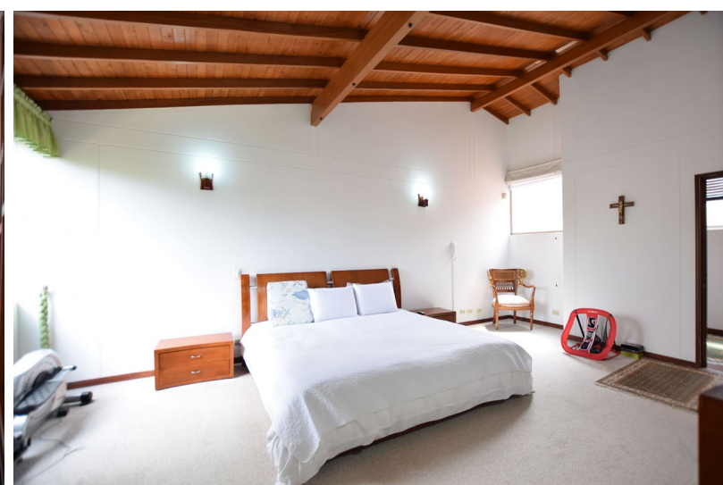
Techos altos tanto en zona social como en las zonas privadas