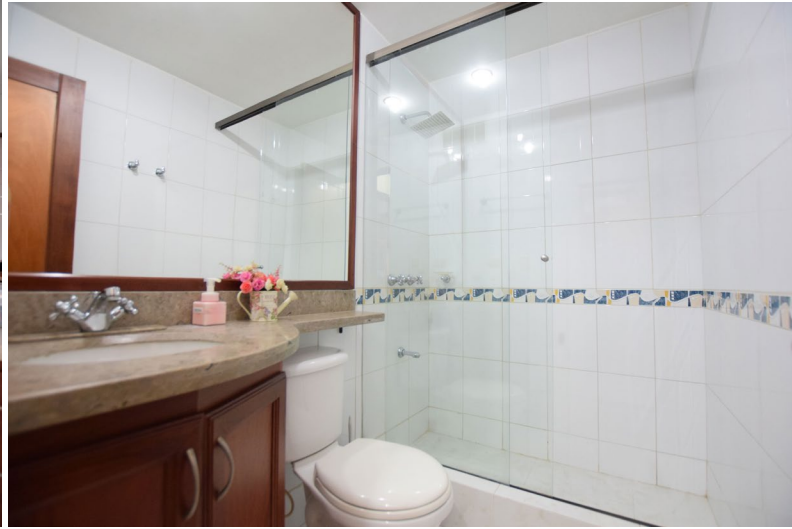
Baños completos con divisiones en vidrio templado y ventilación natural