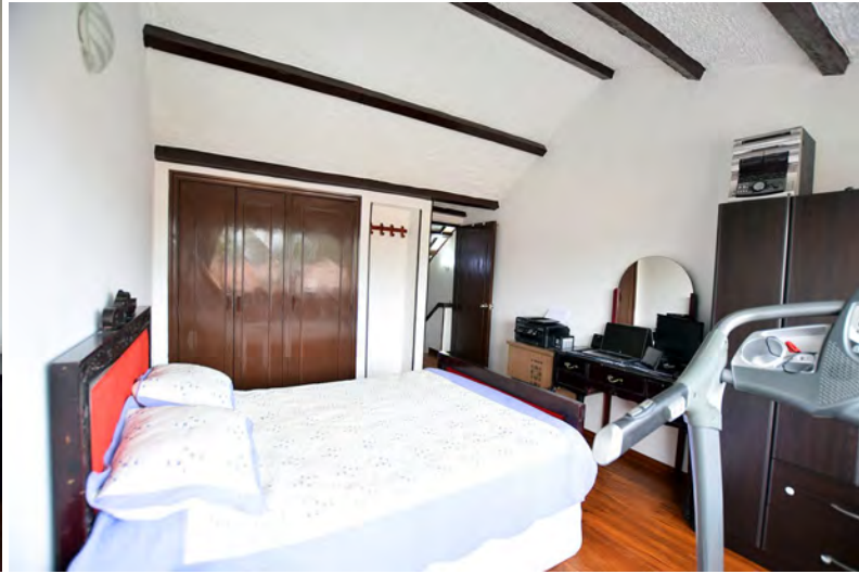
Habitaciones amplias e iluminadas