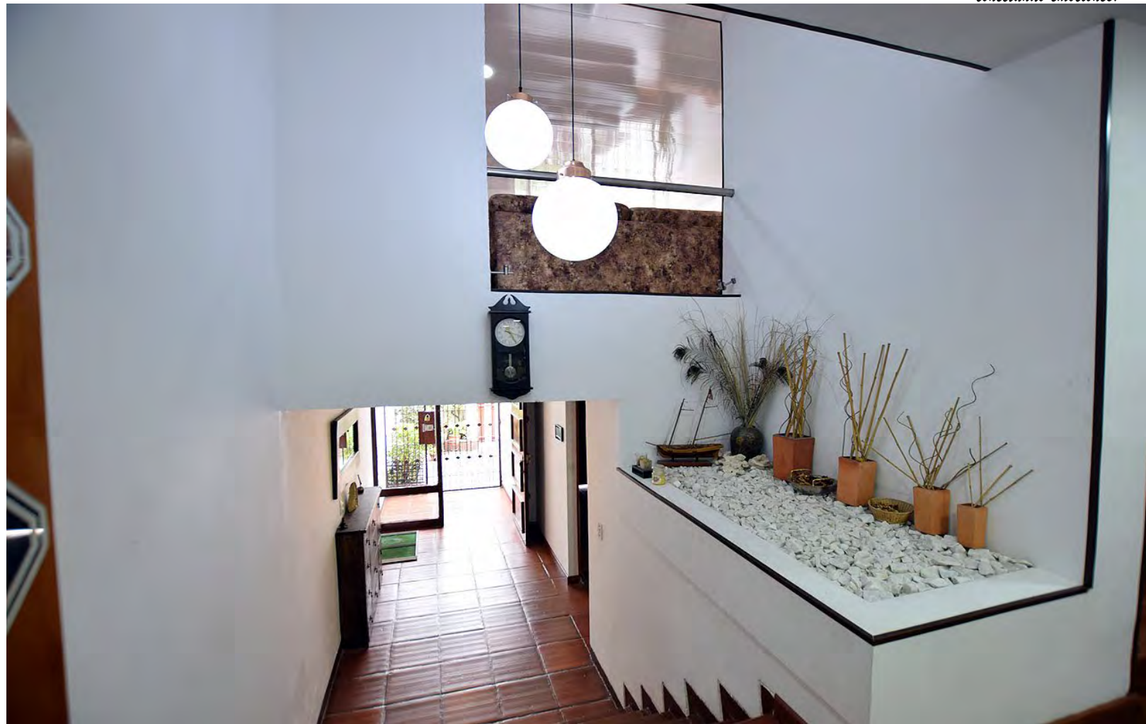
Sala auxiliar en primer piso