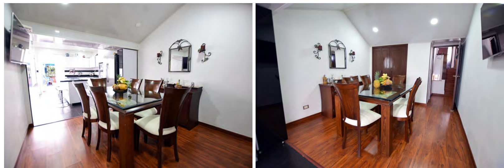
Comedor principal independiente Cocina tipo americano.