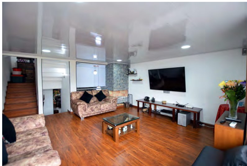
Sala amplia y acogedora