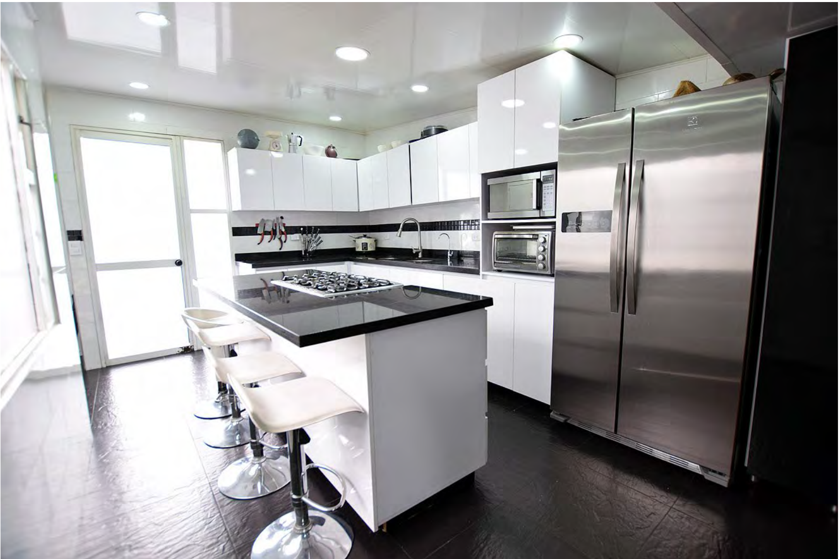
Espacios completos de alacena