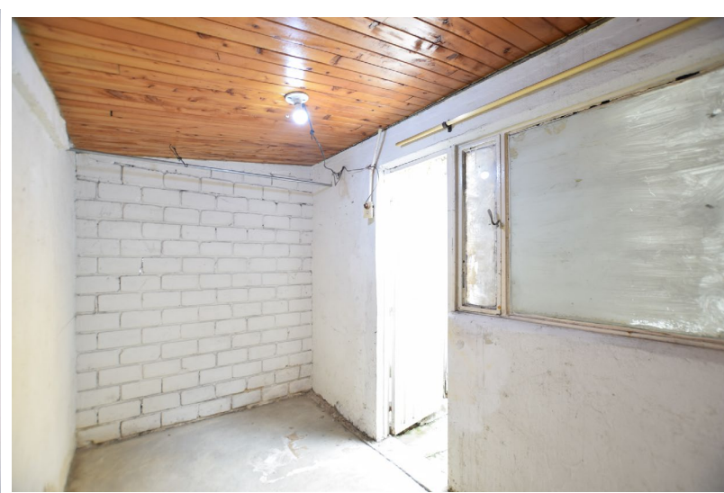
Depósito y entrada por la parte posterior de la casa