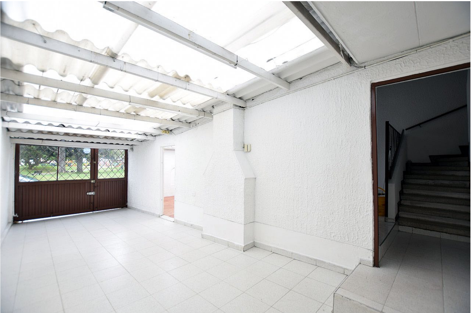
Parqueadero cubierto para dos vehículos. Sala con chimenea y patio en la parte frontal de la casa.