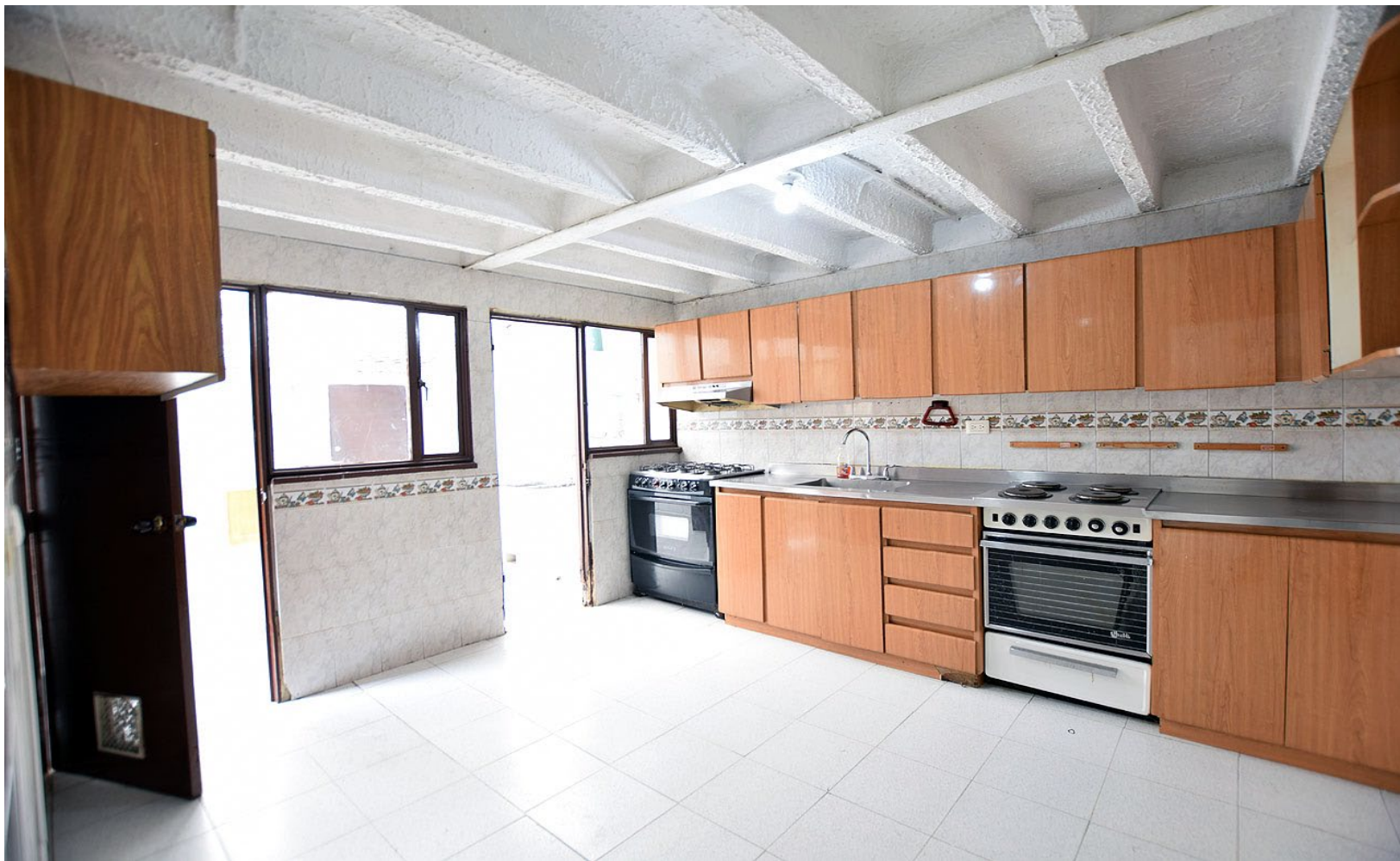
Cocina integral amplia con doble horno, campana extractora y espacios completos de alacena. Comedor y sala de estar en primer piso