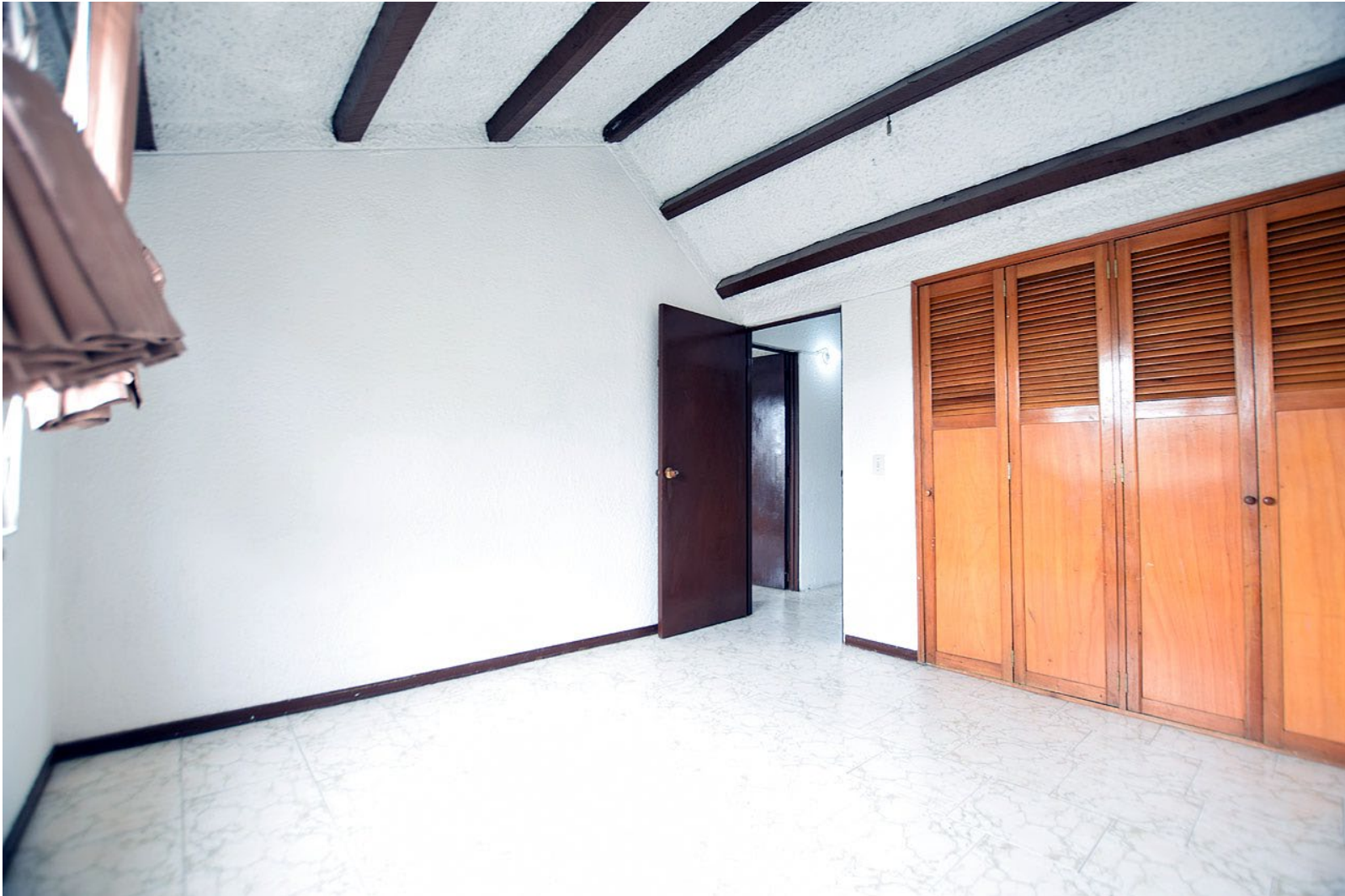
Amplias habitaciones con techos altos y closets completos